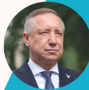
Губернатор Санкт-Петербурга Александр Беглов

— Мы продолжаем повышать уровень поддержки петербургских семей с детьми. Однако, чтобы повысить рождаемость, необходим комплексный подход, включающий улучшение жилищных условий, доступность качественной медицины, возможность обучения и работы для женщин, развитие семейно-ориентированной инфраструктуры. Нам недостаточно только финансово поддерживать семьи. Нужно создавать условия, чтобы люди чувствовали себя уверенно, могли совмещать карьеру и семью.